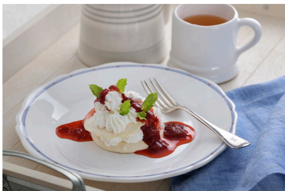
▲ALS 患者さん向け嚥下食のイメージ

当社は協賛のほか、当社グループの従業員ボランティアが ALS 患者さんの試合観戦をサポートします。また試合前には、場外に ALS 疾患啓発ブースを設け、当社ウェブサイトで公開中の ALS 患者さん向け嚥下食「世界を旅する ALS レストラン」レシピをもとに、学校法人山口中村学園中村女子高等学校の調理科の生徒さんが、地元の食材を用いてアレンジし製作する菓子をチャリティー提供するほか、ダブル技研株式会社の協力のもと、ALS 患者さんが視線で文字を入力し意思を伝える意思伝達装置を使用し、ALS 患者さんや J リーガーへ応援メッセージを送るイベントを開催します。